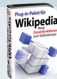
Plug-ins für Wikipedia